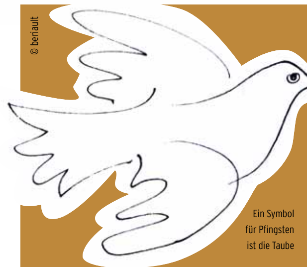
Ein Symbol für Pfingsten ist die Taube

Pfingsten ist neben dem kirchlichen Hintergrund auch von der beginnenden Sommerzeit (Mai) und von vermutlich vorchristlichen Fruchtbarkeitsriten geprägt. Bretonische Sagen, französische und deutsche Ritterromane erzählen zum Beispiel von glanzvollen Pfingstfesten des sagenhaften Königs Artus zu Glamorgan (5./6. Jahrhundert). Pfingsten blieb lange Zeit der beliebteste Termin der höfisch-ritterlichen wie der patrizischen Turniere und wurde es auch für große Schützenfeste. Eine der bekanntesten regionalen Veranstaltungen heutiger Zeit ist der Flachsmarkt rund um die Burg Linn in Krefeld, der immer zu Pfingsten stattfindet – diese Jahr bereits zum 38. Mal. Auch wenn es sich um einen Handwerkermarkt handelt, prägen ritterliche Darbietungen und Schauturniere das Bild dieses Marktes.